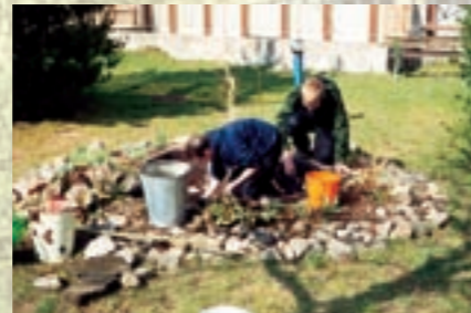
links: Reinigung des Teiches durch Schulgärtner der 7. Klasse rechts: Bau des neuen Gerätehauses durch Hauptschulklasse 9

rechts: „sie geht wirklich“ – es ist 11.30 Uhr