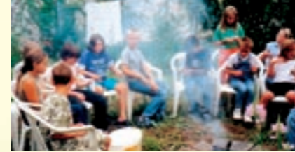
oben: Erntefreuden am Kartoffelfeuer unten: Artenvielfalt im Kräuterbeet